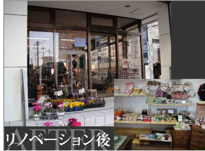
リノベーション後