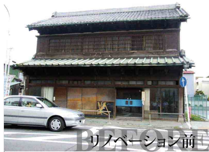
リノベーション前