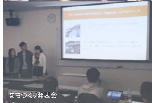
まちづくり発表会