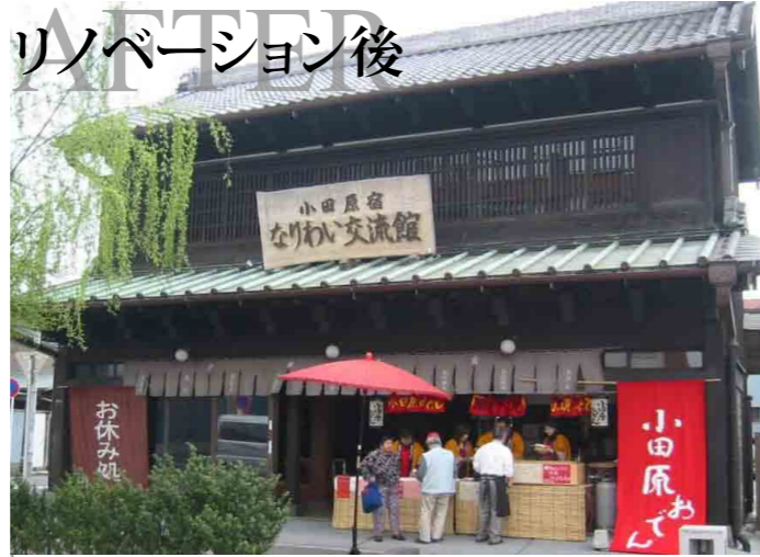
リノベーション後