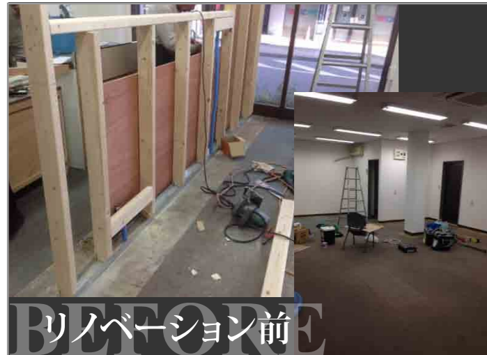
リノベーション前