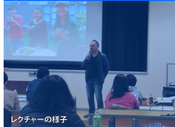
レクチャーの様子