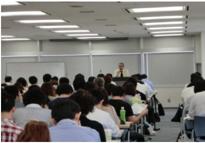
※過去の講義風景です