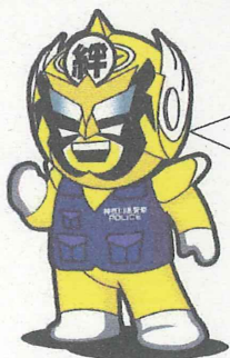
振り込め詐欺撲滅ヒーロー 「絆」大使振り込めセンジャー

まだ、「自分は大丈夫」と思っていないませんか？そう思っている人がだまされています。犯人から物理的に遮断することが大切です。これらの対策をぜひ試してみてください！