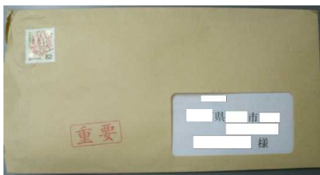
【封筒の表面（裏面は記載なし）】

『重要』と朱印が押された封筒を開けると、『総合消費料金に関する訴訟最終告知のお知らせ』と題するA4の用紙が入っており、具体的な会社名は書かず、「貴方の利用されていた契約会社、ないし運営会社側から契約不履行による民事訴訟が提出された」などと書かれていて、「取り下げ等のお問合せ窓口」として『国民訴訟通達センター』『国民訴訟お客様管理センター』などに電話させ、「弁護士の紹介」や「裁判回避のための費用」などと言って、現金を支払うよう要求したり、コンビニエンスストア等で電子マネーの購入を指示され、コンビニ決済で代金を支払わせる手口となります。