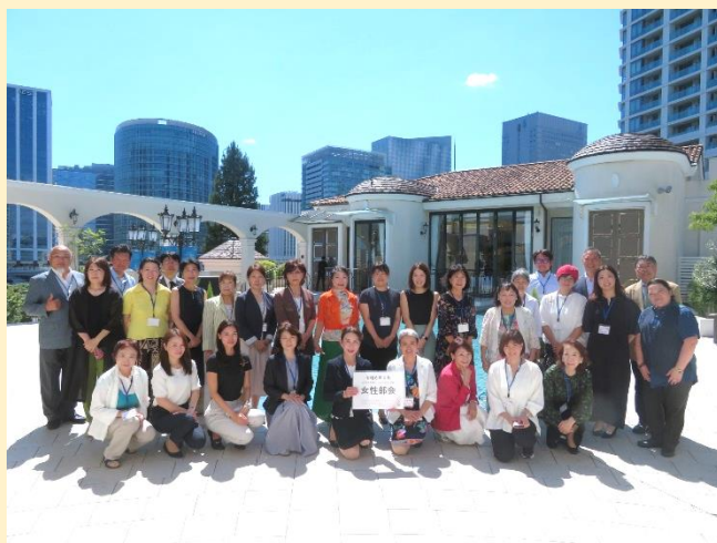
女性部会（通称：SWAT=Shining Woman's Association Team）