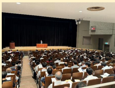
会場の様子 (エポックなかはら)