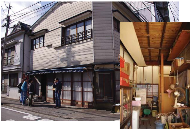
元染物店(10年間無人)