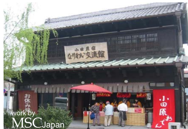
小田原宿なりわい交流館